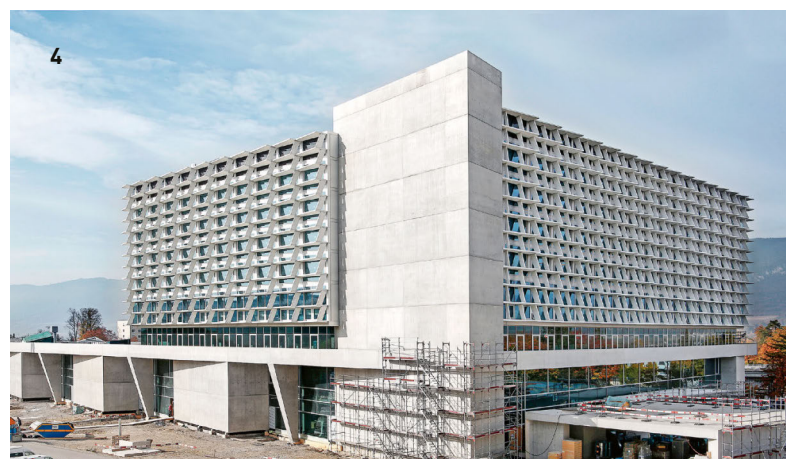
1 Neubau Mehrfamilienhaus Boden, Andermatt / 2 Neubau Logistikhalle Migros Verteilbetrieb, Neuendorf AG / 3 Neubau KVA Kebag, Zuchwil / 4 Neubau Bürgerspital Solothurn