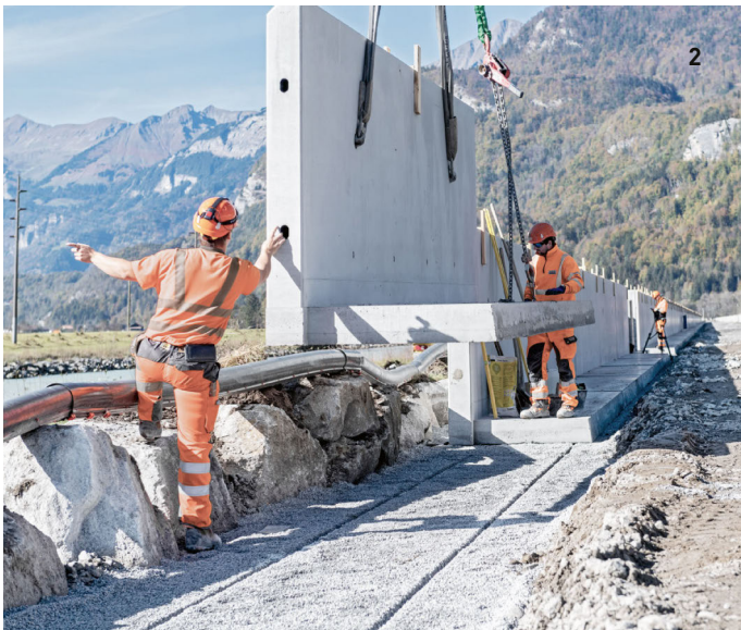
1 Limmattalbahn, Zürich/ 2 Totalumbau Bahnstrecke, Junzlen/ 3 Südwestumfahrung, Sins 4 Gesamtinstandsetzung Gotthardpassstrasse, Andermatt

Der Ingenieurbau zählt zu den anspruchsvollsten Fachbereichen im Bauwesen und erstellt sämtliche Kunstbauten für Infrastrukturanlagen, Kraftwerke, Seilbahnen etc. Der Ingenieurbau schafft einzigartige Bauwerke aus Beton und Stahl – von einfachen Stützmauern über ästhetisch gestaltete Brücken bis hin zu technisch komplexen Kraftwerksbauten. Aufgrund ständig steigender Anforderungen spielen im Bereich Ingenieurbau neueste technische und baubetriebliche Entwicklungen eine grosse Rolle. In jedes einzelne Bauprojekt fließen die weltweite Erfahrung und das Wissen der Mitarbeitenden eines der grössten europäischen Bautechnologiekonzerne mit ein. Wenn Bauwerke aus Beton und Stahl einer Instandsetzung bedürfen, kümmert sich STRABAG auch um diese. Unsere Sanierungsspezialistinnen und -spezialisten sorgen dafür, dass die Tragfähigkeit und die Sicherheit auch in Zukunft gewährleistet sind. Neueste Baustofftechnologie und modernste Verfahren werden hierbei eingesetzt.