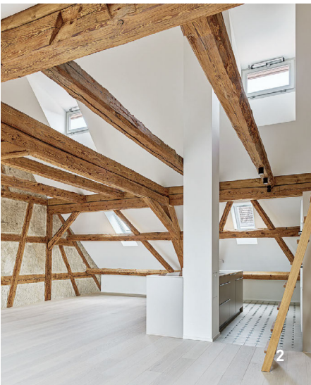
1 Neubau Elefantentpark, Zoo Zürich © Walt + Galmarini / 2 Umbau Oberer Felsenhof, Andelfingen 3 Dachrekonstruktion Bahnhofquai, Zürich / 4 Hagmann-Areal, Winterthur

Mit der zunehmenden Bedeutung des Baustoffs Holz haben wir auch unseren Bereich Holzbau über die Jahre erfolgreich ausgebaut. In unserer eigenen leistungsstarken Holzbaubauabteilung fertigen wir mit modernen Maschinen selbst die zu verbauenden Holzelemente vor und bieten somit alle Leistungen aus einer Hand an. Die Details werden mit innovativen 3-D-Zeichnungs- und Planungsprogrammen visualisiert und kundengerecht optimiert. Für die fachgerechte Montage setzt STRABAG technisch hochstehende Hilfsmittel ein.