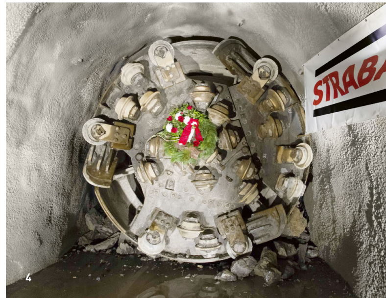
1 Gotthard-Basistunnel, Baulos Erstfeld / 2 Tunnel Umfahrung, Küblis / 3 Galerie d'amenée Farettes, Aigle / 4 Parallelschacht Kraftwerk, Innertkirchen / 5 Nebenkaverne Kraftwerk, Innertkirchen