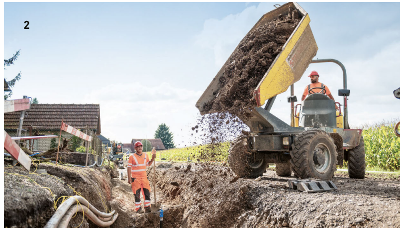
1 Belageinbau, Mosseedorf 2 Sanierung Aarwangenstrasse, Wynau 3 Asphaltierung Weinlandstrasse, Andelfingen

Die steigenden Verkehrszahlen, kombiniert mit den gewünschten kurzen Bauzeiten und der Komplexität von Strassenbauprojekten im Bestand sowie beim Neubau, erfordern grosses Know-how und viel Erfahrung. Wir unterstützen unsere öffentliche und private Kundschaft als kompetente Partnerin ganzheitlich von der Planung bis zur Realisierung in den Bereichen Strassenbau, Gleistief- und Werkleitungsbau. Gemeinsam mit Ihnen setzen wir uns täglich dafür ein, dass unsere Verkehrsinfrastruktur auf hohem Niveau funktioniert – für die Mobilität von heute und morgen.