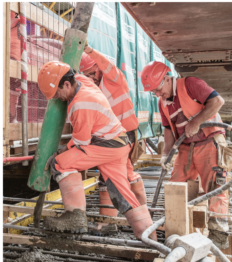
1 Neubau Taminabrücke, Pfäfers-Valens / 2 Ausbau Personenunterführung, Bahnhof Winterthur