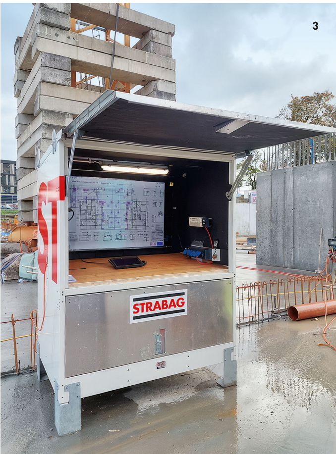
1 KW Schils, Flums / 2 Siemens Building Technologies, Büro- und Produktionsgebäude, Zug / 3 Campus Technik, Digitales Planhaus / 4 Sanierung Schiedhaldensteig, Küssnacht