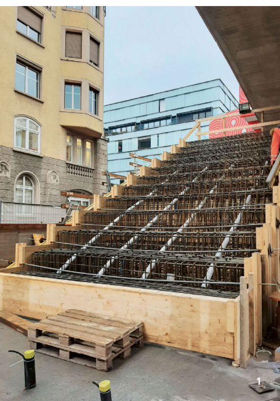
1 Treppenschalung Personenunterführung, Bahnhof Winterthur / 2 Werkhalle, Lindau / 3 Wandschalung Limmattalbahnhof Los 6, Dietikon-West / 4 Sichtschalung Pfeiler, Brücke Wattwil

Eine unserer Spezialitäten sind Betonschalungen: Ob komplexe Tunnelschalung, herausfordernde Brückenschalung, Rohbauspezialschalung oder nach Kundenwunsch gefertigte Formteile – in unserer Zimmerei stellen wir mit unserer Erfahrung und unserer 5-Achsen-CNC-Fräse alles problemlos her. Wir fertigen exakte Betonschalungen nach Plan, die umgehend und mehrfach verwendet werden können. Unser Schalungsbauteam steht auch bei Planung und Umsetzung zur Verfügung und berät Sie gerne, um das Optimum aus jedem Schalungsteil herauszuholen. Bei uns sind Sie dafür an der richtigen Stelle.